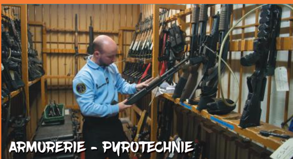
ARMURERIE - PYROTECHNIE