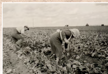
Gouzangrez. Arrachage des betteraves. 1938.

Aujourd'hui, alors même que les agriculteurs n'ont jamais été aussi peu nombreux et l'agriculture, en constante mutation, cette exposition nous donne ainsi des clés de compréhension et nous incite à imaginer l'agriculture de demain.