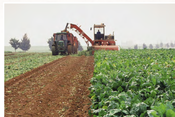
Vexin. Récolte des betteraves. Vers 1990.