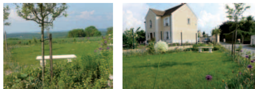
Un banc de détente pour les nombreux promeneurs a été implanté fin avril dans la zone paysagère, au croisement de la rue de l'Isle et du chemin de l'Isle.