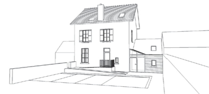
Le coût des travaux est estimé à 167 000€HT. Compte tenu du refus de l'Etat de subventionner le projet, les travaux seront autofinancés.

Fin de travaux prévue en juin 2012. (le permis de construire a été accordé début juin).