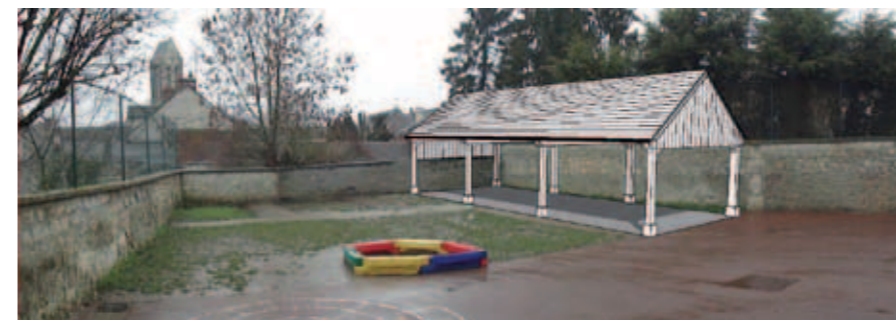
Le permis de construire a été accordé fin juillet. Le coût des travaux, s'élèvera à : 59 068€HT. Compte tenu du refus de l'Etat de subventionner ces travaux, ils seront autofinancés.

Les travaux prévus début novembre seront achevés au début de l'année 2012, en offrant aux enfants et à leurs enseignants un abri contre les intempéries et une aire couverte de 56m 2 pour des séances d'éducation physique. Un plan de sécurité sera mis en œuvre, dès l'ouverture du chantier, pour protéger les élèves, les enseignants, le personnel communal et le personnel des entreprises.