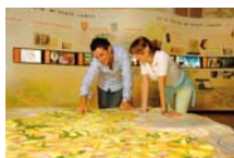
Musée du Vexin français

La vocation agricole du territoire est illustrée au musée de la Moisson à Sagy autour d'une remarquable collection de machines et d'outillage agricoles présentée dans un ancien corps de ferme réhabilité.