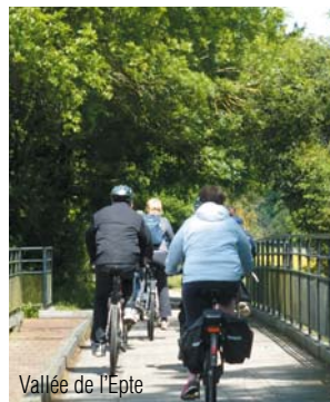
Vallée de l'Epte

Le Vexin français, terre d'histoire et de tradition se dévoile à ses visiteurs grâce aux sites culturels et patrimoniaux qui ont fait sa renommée : le Domaine de Villarceaux, La Roche-Guyon, l'un des plus beaux villages de France, les Jardins d'Ambleville, Auvers-sur-Oise, cité des Impressionnistes, le site gallo-romain de Genainville ou bien encore la chaussée Jules-César.