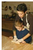
Maison du Pain