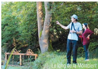
Le long de la Montcient

Signataire de la charte européenne du tourisme durable dans les espaces protégés depuis 2001, le Parc est également labellisé « Pays d'art et d'histoire » depuis 2014.