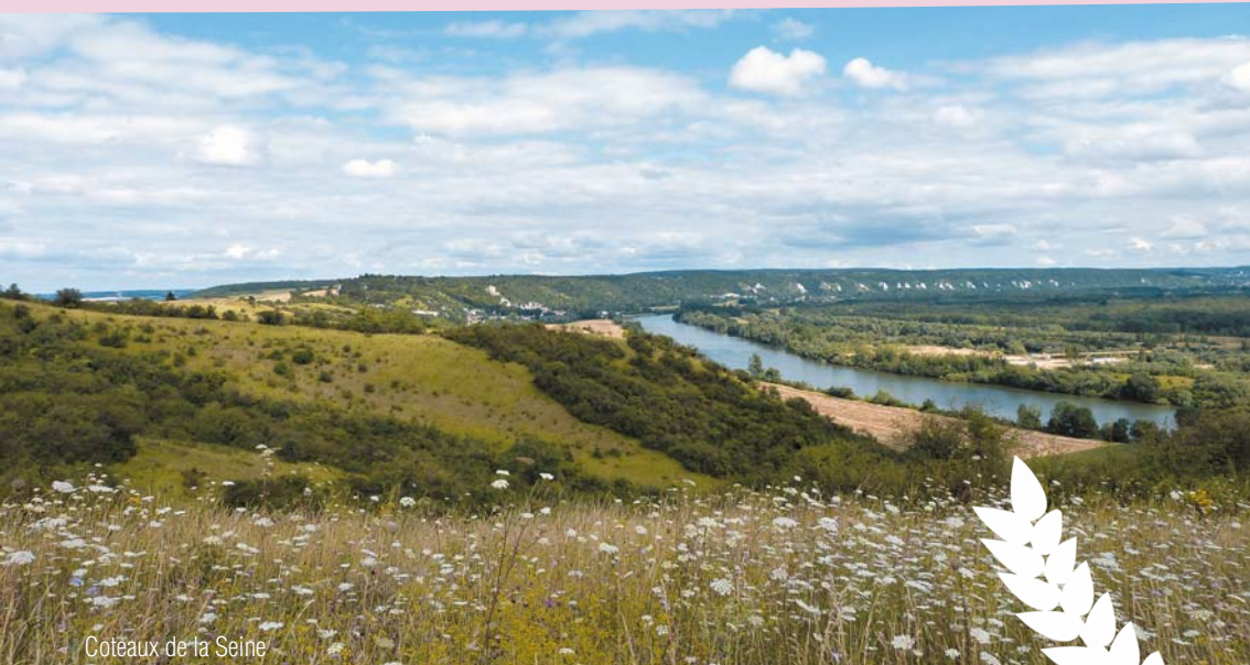
Côteaux de la Seine

dans le Parc naturel régional du Vexin français