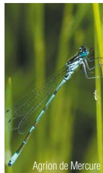
Agrion de Mercure

Témoin des traditions et des coutumes, le petit patrimoine rural, et notamment les croix pattées, ponctuent les paysages vexinois, qui ont tant séduit les Impressionnistes.