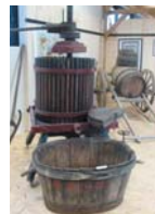
Maison de la Vigne

Le moulin de la Naze (maison de la Meunerie) à Valmondois retrace la vie quotidienne des meuniers de la vallée du Sausseron.