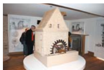
Moulin de la Naze