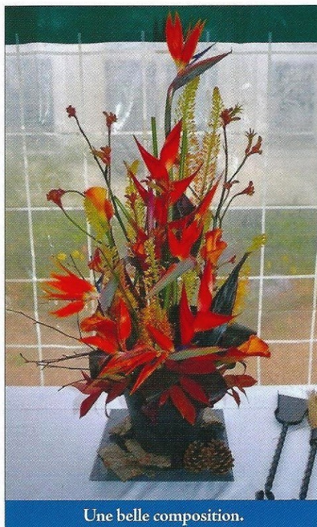
Une belle composition.

Après ce parcours initiatique, je deviens membre des jurys des concours d'art floral de Sevrans, Tremblay-en-France, Montreuil et Chelles ».